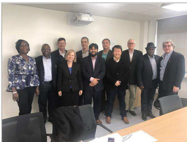
Grupa pracująca nad normą ISO dla Zarządzania Wiedzą w trakcie ostatniego spotkania.

Nie możemy udostępnić tekstu normy. Dokument jest chroniony prawem autorskim i można go albo kupić od ISO albo obejrzeć na bezpiecznych stronach, jak to wyjaśniono poniżej. Dlatego też nie możemy udostępnić w ramach newslettera zawartości normy.