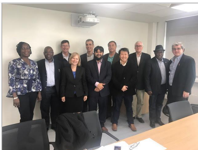
Grupa pracująca nad normą ISO dla Zarządzania Wiedzą w trakcie ostatniego spotkania.

Nie możemy udostępnić tekstu normy. Dokument jest chroniony prawem autorskim i można go albo kupić od ISO albo obejrzeć na bezpiecznych stronach, jak to wyjaśniono poniżej. Dlatego też nie możemy udostępnić w ramach newslettera zawartości normy.